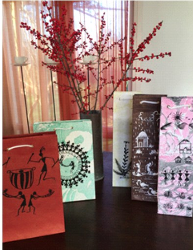
wijn- en cadeautassen