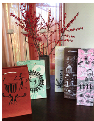
wijn- en cadeautassen

De wijn -en cadeautassen kosten € 30,- per 10 stuks, incl. verzendkosten. Als je ze zelf in IJlst of Arnhem ophaalt is dat € 25,-. Je bepaalt uiteraard zelf hoeveel stuks je van elk wilt. Bestellen kan via vriendenvanmaher@gmail.com .